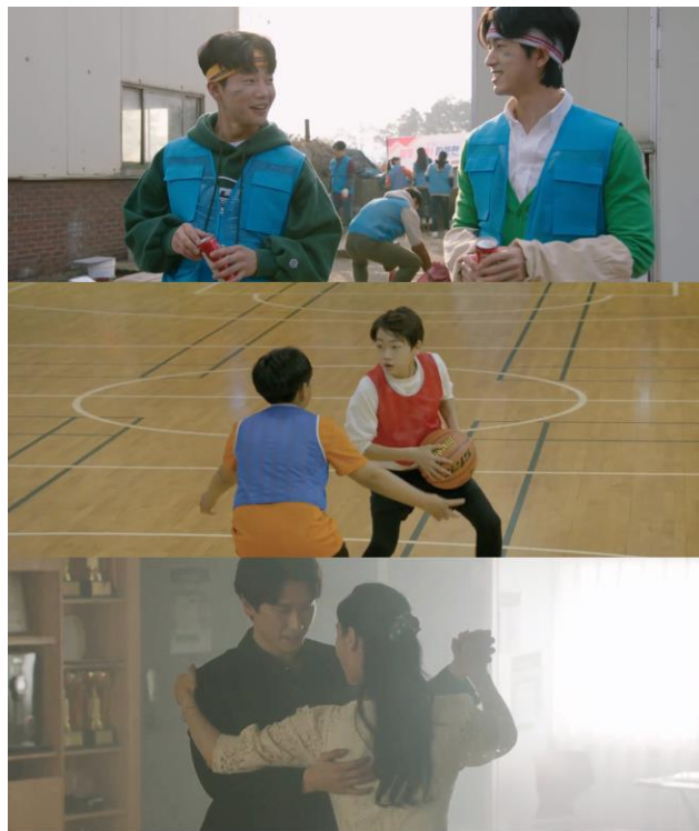
[사진] 사노피가 제작한 웹 드라마 ‘세 개의 보석’ 주요 장면

서울 - 2021 년 2 월 4 일 - 글로벌 헬스케어 기업 사노피(Sanofi)의 국내 제약사업부문인 사노피-아벤티스 코리아(대표 배경은)가 혈우병 환자 인식 개선을 위해 웹 드라마 ‘세 개의 보석’을 2 월 3 일부터 온라인에 공개한다. 웹 드라마 ‘세 개의 보석’은 혈우병에 대한 오해와 편견을 바로 잡고 혈우병 및 혈우병 환자와 더불어 살아가는 사회를 이루고자 기획된 옴니버스형 3 부작 드라마이다.